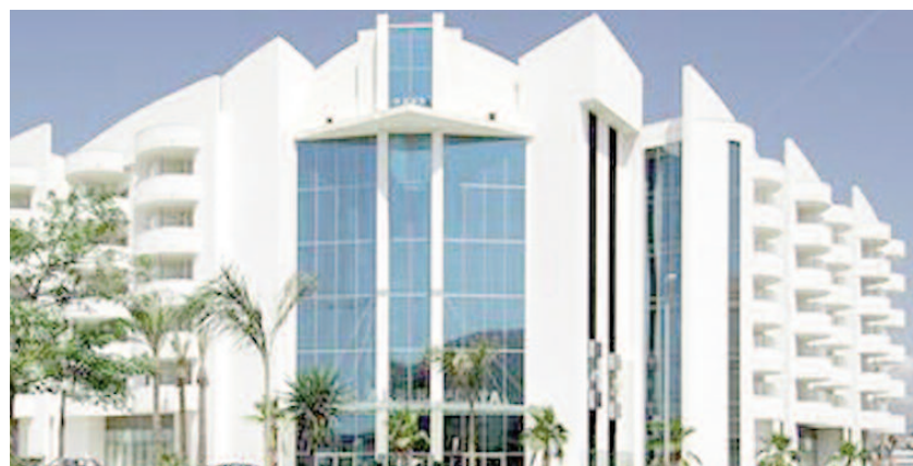
Hotel Albir Playa